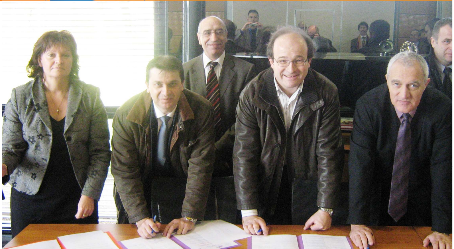
Des Jumelés signataires